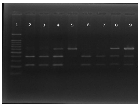
شکل ۱: ستون ۱؛ مارکر ۱۰۰ bp، ستون‌های ۲ و ۳ و ۶ و ۷ ژنوتیپ GG باند ۳۸۲ bp، ستون‌های ۴ و ۸ و ۹ ژنوتیپ AG باند ۲۲۲ bp و ستون ۵ ژنوتیپ AA باند ۶۰۴ bp را نشان می‌دهند.

محصول PCR به صورت باندهای ۶۰۴ bp بر روی ژل آگارز قابل رؤیت بود که در تمام موارد به صورت تک باند ملاحظه گردید. محصولات PCR بعد از اثر آنزیم HaeIII و RFLP بر روی ژل آگارز ۲٪ مشاهده گردیدند (شکل ۱).