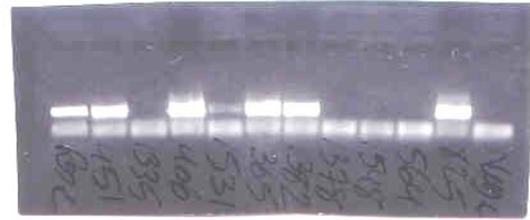
شکل ۱: باندهای مربوط به بیماران همراه کنترل مثبت و منفی و سائز مارکرپس از الکتروفورز

پلاسما مورد آزمایش قرار گرفتند. بررسی به عمل آمده نشان داد که آزمایش TTV-PCR در ۱۰۳ نفر (۴۱٪) مثبت و در ۱۴۷ نفر (۵۹٪) منفی بود.