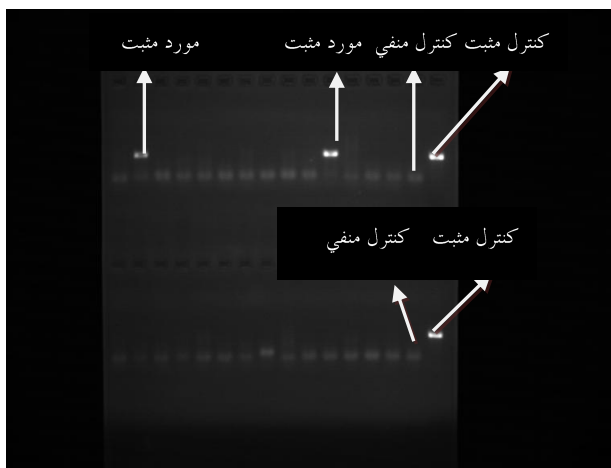
شکل ۲: در یک نوبت کاری دو مورد از مجموعه‌های سرمی دارای واکنش مثبت بودند که با علامت پیکان مشخص شده‌اند.