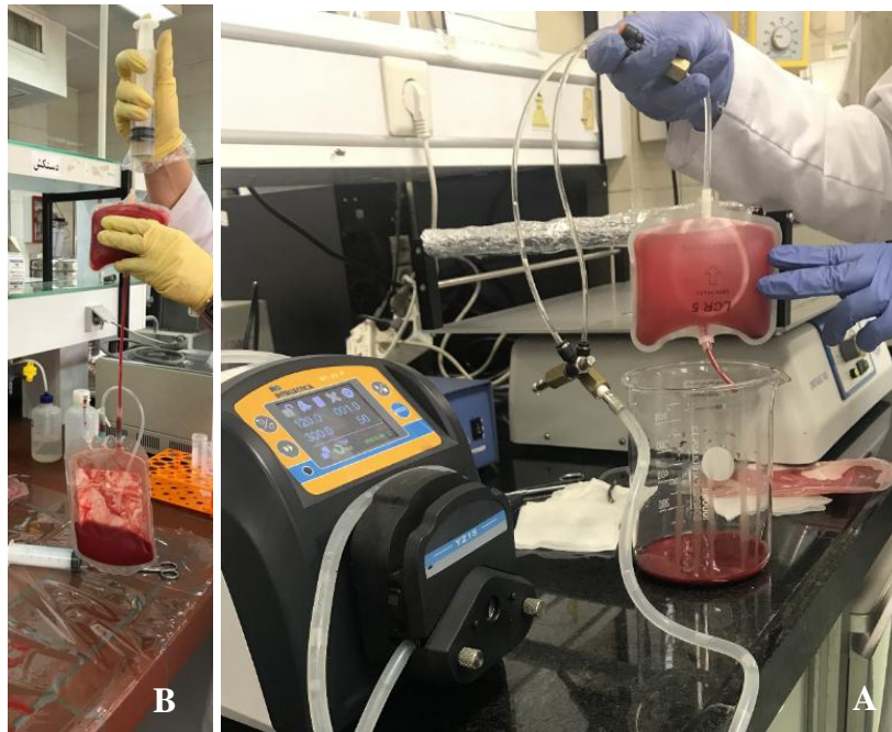
شکل ۲: قسمت A: شستشوی مکانیکی با کمک پمپ پرستالتیک، قسمت B: شستشوی دستی فیلتر به صورت معکوس