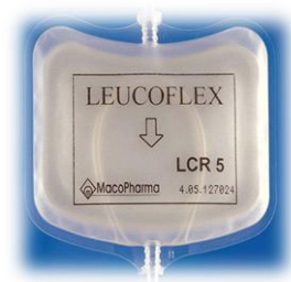
شکل ۱: فیلتر Leucoflex LCR5

خلاف جهت ورودی فیلتر (Back Flush) به روش دستی صورت گرفت. برای شستشوی دستی، میزان ۱۵۰ میلی‌لیتر بافر توسط سرنگ ۶۰ میلی‌لیتری با فشار پیستون و از جهت مخالف ورودی وارد فیلتر شد و باقی‌مانده بافر در فیلتر با استفاده از سرنگ پر شده از هوا تخلیه گردید. سپس برای انجام سریع‌تر شستشوی فیلترها از یک سیستم مکانیکی طراحی و ست آپ شده استفاده شد (شکل ۲).