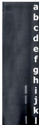
شکل ۲: نتیجه آزمایش PCR بر روی رقت‌های ۱، ۲، ۳، ۴، ۵، ۶، ۷، ۸، ۹، ۱۰، ۱۱، ۱۲، ۱۳، ۱۴، ۱۵، ۱۶، ۱۷، ۱۸، ۱۹، ۲۰. نمونه خون بیمار مبتلا به پلاسمودیوم فالسیپاروم a: کنترل فاقد نمونه (کنترل منفی) b تا h: نمونه خون اهداکنندگان i و j و k و l: به ترتیب رقت‌های ۱، ۲، ۳، ۴، ۵، ۶، ۷، ۸، ۹، ۱۰، ۱۱، ۱۲، ۱۳، ۱۴، ۱۵، ۱۶، ۱۷، ۱۸، ۱۹، ۲۰. نمونه خون آلوده به پلاسمودیوم فالسیپاروم l: کنترل با DNA پلاسمودیوم فالسیپاروم (کنترل مثبت)

a: کنترل فاقد نمونه (کنترل منفی) b و c و d و e: به ترتیب رقت‌های ۱، ۲، ۳، ۴، ۵، ۶، ۷، ۸، ۹، ۱۰، ۱۱، ۱۲، ۱۳، ۱۴، ۱۵، ۱۶، ۱۷، ۱۸، ۱۹، ۲۰. نمونه خون مثبت از نظر پلاسمودیوم ویواکس f و g و h و i: به ترتیب رقت‌های ۱، ۲، ۳، ۴، ۵، ۶، ۷، ۸، ۹، ۱۰، ۱۱، ۱۲، ۱۳، ۱۴، ۱۵، ۱۶، ۱۷، ۱۸، ۱۹، ۲۰. نمونه خون مثبت از نظر پلاسمودیوم فالسیپاروم j و k و l و m: به ترتیب رقت‌های ۱، ۲، ۳، ۴، ۵، ۶، ۷، ۸، ۹، ۱۰، ۱۱، ۱۲، ۱۳، ۱۴، ۱۵، ۱۶، ۱۷، ۱۸، ۱۹، ۲۰. نمونه خون مثبت از نظر پلاسمودیوم فالسیپاروم و ویواکس n: کنترل با DNA پلاسمودیوم فالسیپاروم و ویواکس (کنترل مثبت) o: شاخص اندازه DNA