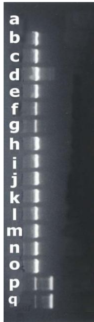
شکل ۴: نتیجه آزمایش PCR پلاسمودیوم ویواکس بر روی نمونه خون اهداکنندگان