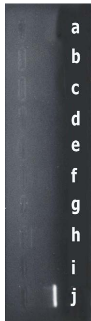
شکل ۶: وجود کنترل داخلی در PCR پلاسمودیوم ویواکس و اثبات عدم وجود ممانعت کننده در PCR پلاسمودیوم فالسیپاروم a: کنترل فاقد نمونه (کنترل منفی) b تا i: نمونه خون اهداکنندگان j: کنترل با DNA پلاسمودیوم فالسیپاروم (کنترل مثبت)

وجود باند کنترل داخلی دلیلی بر عدم وجود ممانعت کننده در نمونه تحت آزمایش و یا حین کار است. لذا برای اثبات عدم وجود ممانعت کننده در PCR پلاسمودیوم فالسیپاروم، محصولات مرحله تخلیص و یا DNA با آب عاری از نوکلئاز به نسبت ۱/۱ رقیق شد و سپس برای عمل تکثیر مورد استفاده قرار گرفت تا اگر ممانعت کننده واکنش در نمونه موجود است، با انجام رقیق سازی میزانش به حداقل برسد و ممانعتی برای PCR نباشد (شکل ۶).