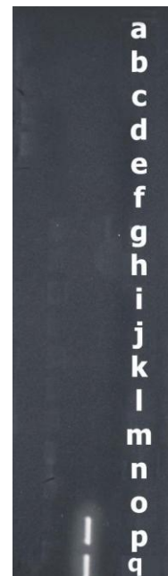
شکل ۵: نتیجه آزمایش PCR پلاسمودیوم فالسیپاروم بر روی نمونه خون اهداکنندگان

در بدو کار از دو کیت اویسنا (Avicenna) ساخته شده در بخش کیت سازی انتقال خون) و پرومگا (Promega) به منظور عمل تکثیر استفاده شد که در مقایسه این دو کیت، مخلوط شماره ۲ و مخلوط اصلی شماره ۱ مربوط به انتقال خون به لحاظ دارا بودن محصولات مثبت با باندهای پررنگ تر و شدت بیشتر و عدم وجود باندهای غیر اختصاصی نسبت به کیت پرومگا قابلیت بیشتری از خود نشان دادند. بنابراین در مراحل تکثیر آزمایش PCR از کیت سازمان انتقال خون استفاده گردید. در نتایج به دست آمده از PCR مربوط به پلاسمودیوم ویواکس، یک باند دیگر علاوه بر باند اختصاصی پلاسمودیوم ویواکس دیده شد که ارتباط با ژنوم انسان داشته و در واقع نوعی کنترل داخلی برای کار انجام یافته، محسوب می شد. در مقابل در نتایج حاصل از PCR پلاسمودیوم فالسیپاروم، باند کنترل داخلی دیده نشد و یا بسیار کم رنگ ظاهر گردید.