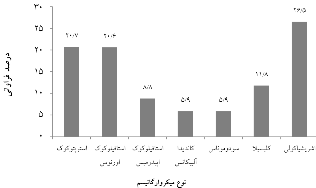
نمودار ۴: توزیع فراوانی میکروارگانیسم‌های رشد کرده در کشت نمونه‌های گرفته شده از بیماران نوتروپنیک تب‌دار بستری در بیمارستان امام سجاد (ع) رامسر طی سال‌های ۱۳۹۰-۱۳۸۵